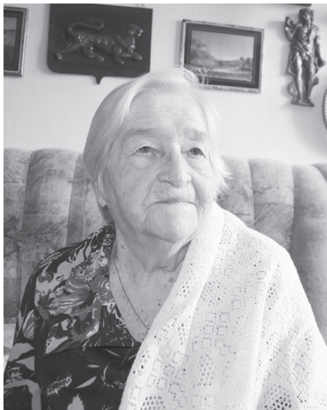
И сегодня согревает плечи шаль, связанная своими руками