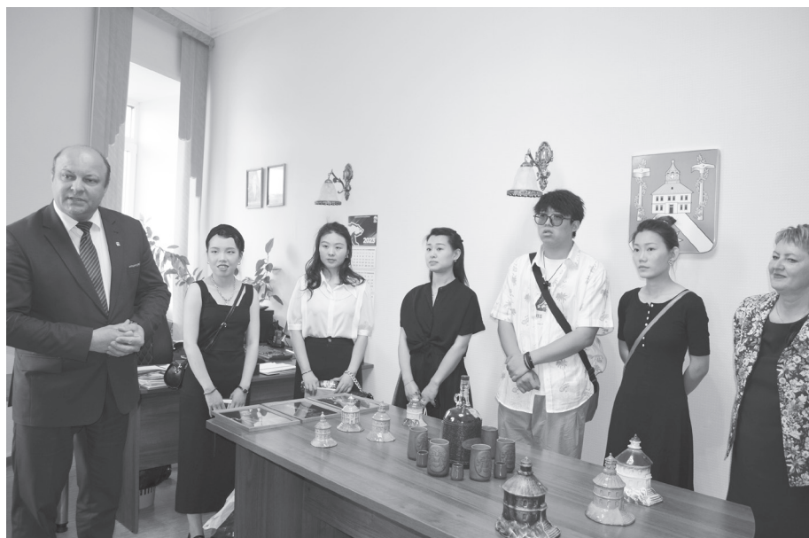
На встрече в администрации.

А далее у китайских студентов была возможность познакомиться с историей старинного поселения (читай: историей России) и культурными традициями Урала. Экскурсию по зданию администрации - («Дом-графин»,