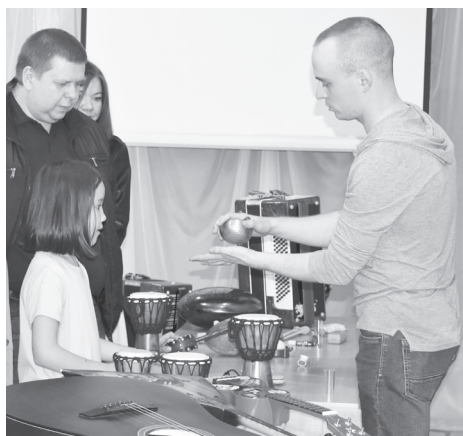
Инструменты из частной коллекции.

Еще одна локация была представлена в виде музыкально-ли-тературного салона конца XIX - начала XX века. Гости приглашали скоротать время за беседой и чаепитием.