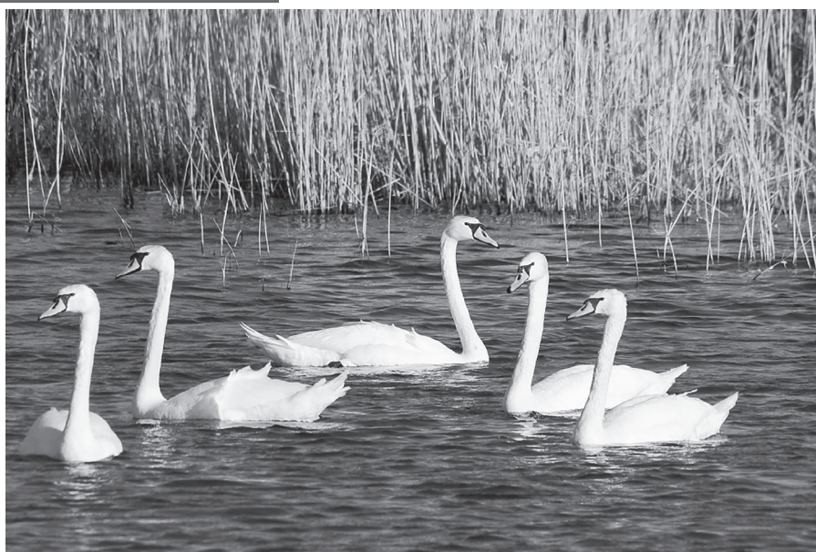
На Малом Верх-Нейвинском пруду в мае поселились лебеди.

В Верх-Нейвинской городской поликлинике возобновил работу кабинет рентгена, флюорографии и маммографии.