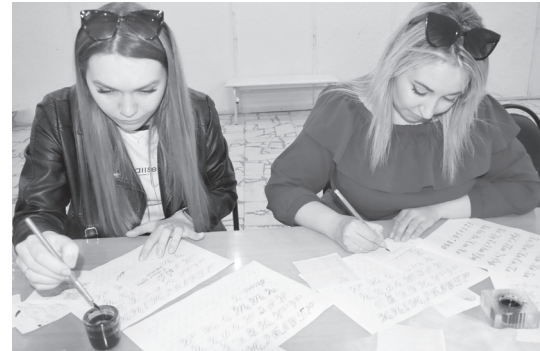
Рукопись - вензельным шрифтом.