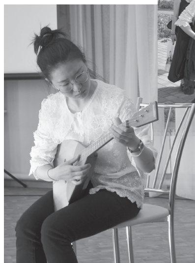
Балалайка звучала в руках китаянки.

Кстати, вначале гостеприимные хозяева Детской школы искусств по русской традиции угощали гостей чаем с пирогами. Как говорится, хлеб-соль!